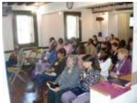
Sorelle in Cristo che ascoltano le testimonianze

Che Dio benedica noi sorelle in Cristo. Amen. hcg